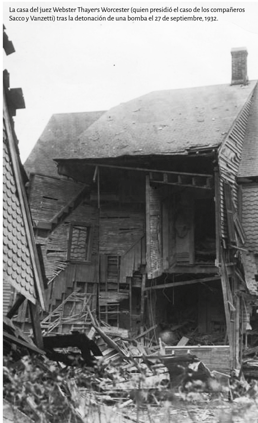
La casa del juez Webster Thayer's Worcester (quien presidió el caso de los compañeros Sacco y Vanzetti) tras la detonación de una bomba el 27 de septiembre, 1932.

¿Una manera difícil de razonar? Quizá sí, pero una vez empleada nunca la olvidas.